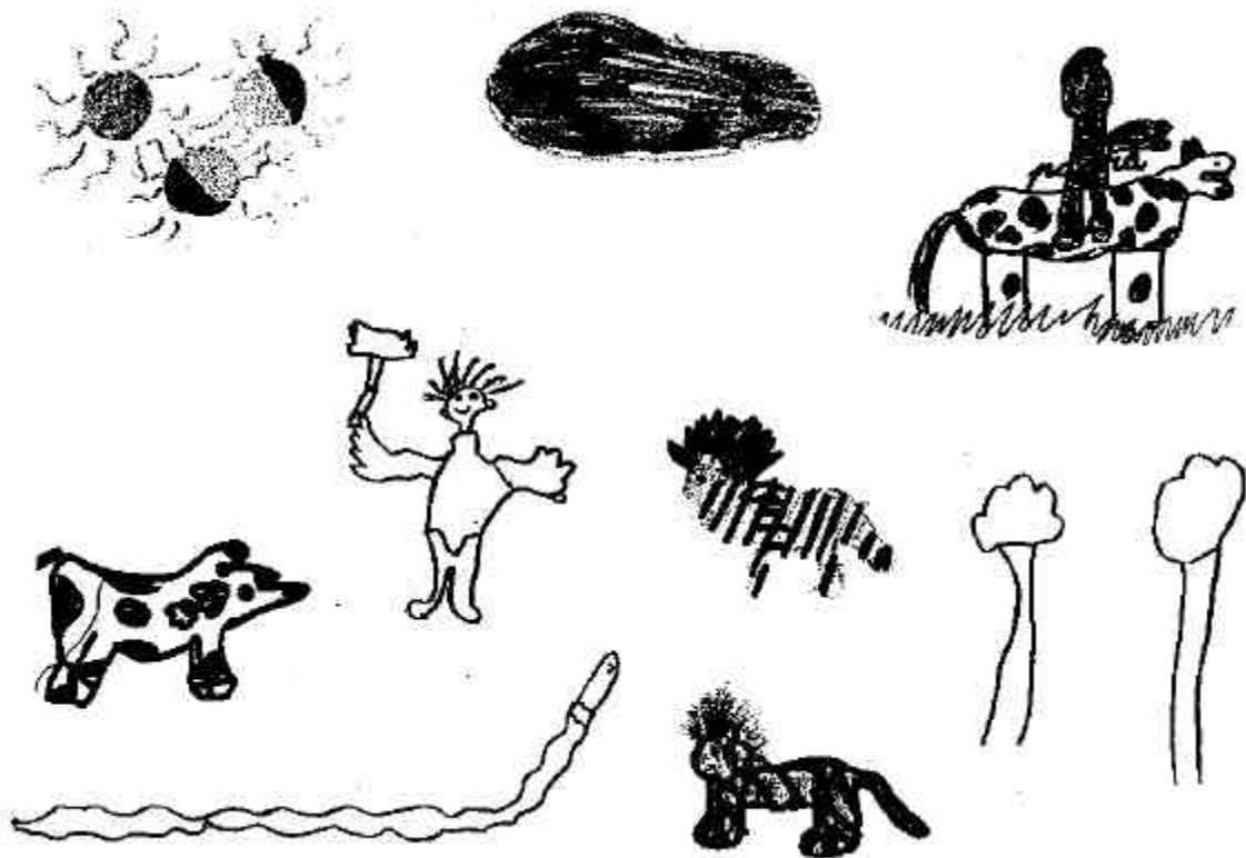
Afbeelding 5: deze tekeningen maakten de kinderen bij het verhaal van boer Pim.