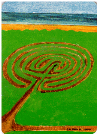
Plaatje 2 Naar het einde Hoogtepunt