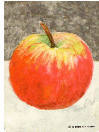
Plaatje 3 Eindbeeld