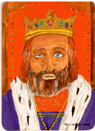
Afbeelding 1: Plaatje 1 Op naar het hoogtepunt Motorisch Moment

Ook dat was verklaarbaar. Een vastgelegd einde (in een beeld) veronderstelde opnieuw dat overzicht over het verhaal. Pas als je als verteller weet waar je heen wilt (het eindbeeld) kun je beginnen. Voor de kinderen staat dat gelijk met een moeilijke topografieopdracht. Je wilt van je eigen huis naar Berlijn, maar je kent alleen de weg tot aan de rand van het dorp.